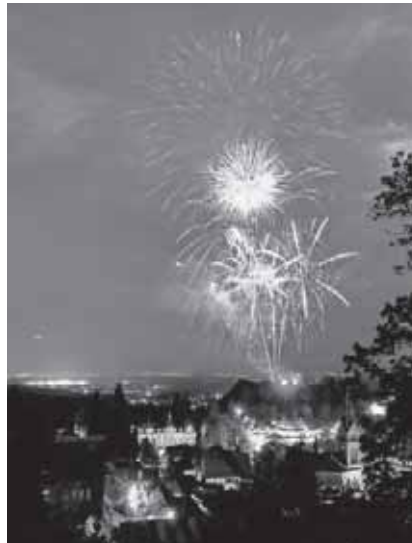
Jubiläumsfeuerwerk von der „Burg Baden“