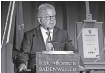
Minister der Justiz und für Europa Herr Guido Wolf bei der Festansprache zum Partnerschaftsjubiläum im Kurhaus