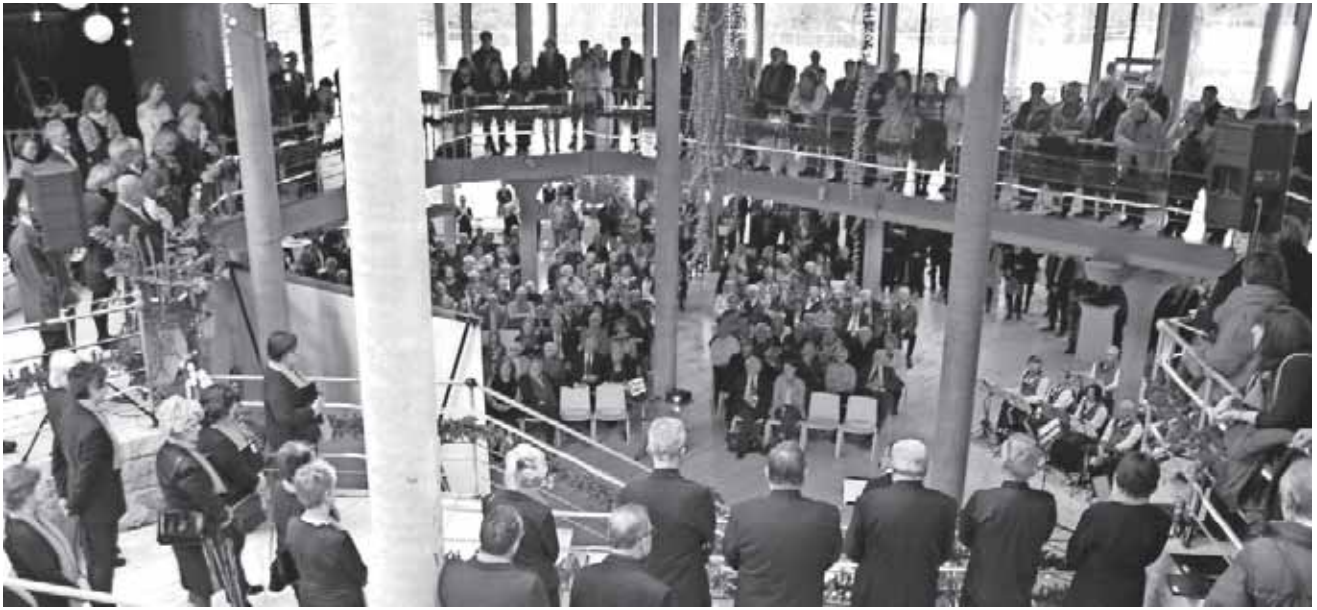
Zahlreiche Einwohner und Gäste waren ins Kurhaus gekommen, um im Kreis der „Badenweiler Familie“ das neue Jahr willkommen zu heißen.