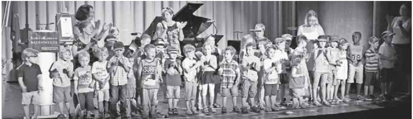
Die Kinder des Kindergartens Badenweiler und Schweighof bei der Eröffnung des Festaktes