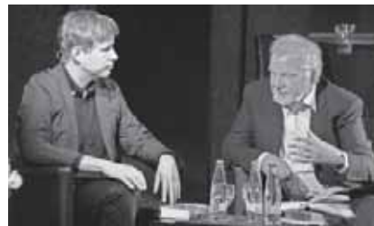
Prof. Dr. Rüdiger Safranski (rechts) im Gespräch mit Daniel Kehlmann

Erneut organisierte und veranstaltete Prof. Dr. Rüdiger Safranski mit dem Bürgerforum die Badenweiler Literaturtage mit großer Resonanz. Der lichtdurchflutete Saal Le Jardin im Kurhaus war bei allen Veranstaltungen gut besucht und bot eine angenehme „geistvolle“ Atmosphäre. „Wenn jemand eine Reise tut... Fahren und erfahren“ lautete das Motto der Veranstaltungsreihe.