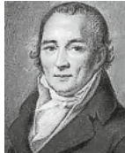
Johann Peter Hebel (1760 - 1826)