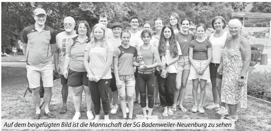
Auf dem beigefügten Bild ist die Mannschaft der SG Badenweiler-Neuenburg zu sehen

Die guten Ergebnisse und Erfolge wurden am Abend im Rahmen eines Grillfestes beim Vereinsheim des TV Neuenburgs gebührend gefeiert.