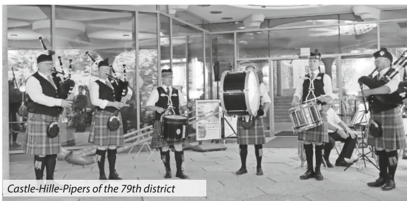
Castle-Hill-Pipers of the 79th district

Vielen Dank für Eure Unterstützung! Wir freuen uns schon sehr auf das nächste Burgfest.