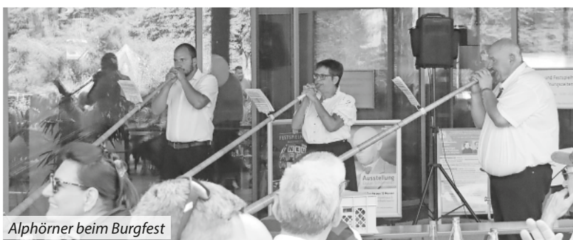
Alphörner beim Burgfest