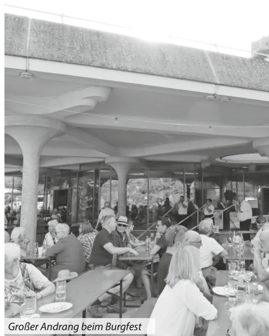
Großer Andrang beim Burgfest