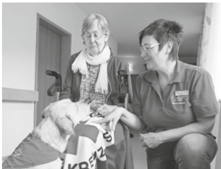
Besuchshund im Einsatz im Elisabethenheim

Die DRK-Besuchshundegruppe „Glückspforten auf Besuch“ des DRK Kreisverbandes Müllheim e. V. wurde 2017 in Kooperation mit dem DRK-Kreisverband Lörrach e.V. gegründet. Bisher wurden 29 Teams (je 1 Hundeführer mit Hund) erfolgreich ausgebildet und geprüft.