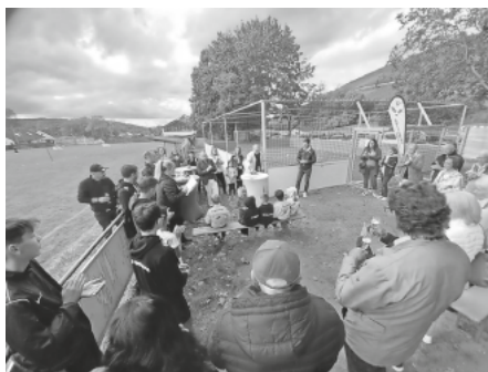
Andrang von jung und alt bei der Eröffnung