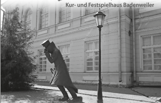
Bronzedenkmal „Mensch im Futteral“ vor Tschechows Gymnasium, heute Museum, in Taganrog

Sonntag, 28. Januar 2024, 18 Uhr Kur- und Festspielhaus Badenweiler