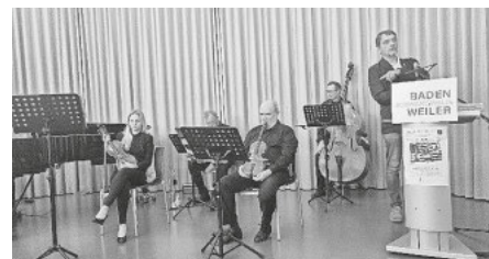
Hochbruck und Da Capo